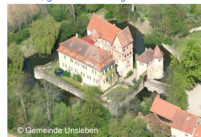
Befestigtes Wasserschloss Unsleben