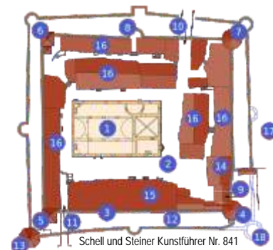
Ostheim, größte Kirchenburg Deutschlands